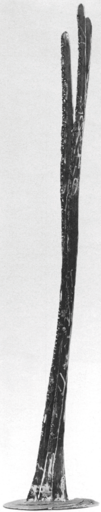
Germano Sartelli scultura | Skulptur, 1994 Ferro | Eisen altezza | Höhe 250 cm ca.